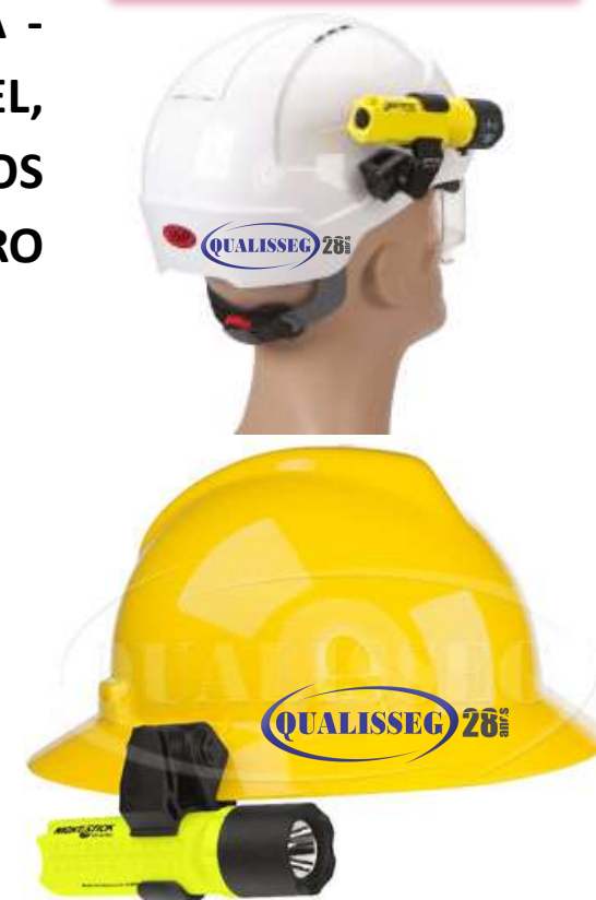
CLIP PARA FIXAÇÃO NA ABA