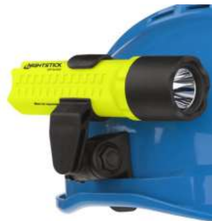
CLIP PARA RASGO NO CAPACETE

CERTIFICAÇÃO INMETRO (APROVADA PARA USO NO BRASIL): Ex ia IIC T3 Ga – Classe I, Zona 0. EXCLUSIVO CERTIFICADO. EM CONFORMIDADE COM REQUISITOS NFPA-1971-8.6 (2013).